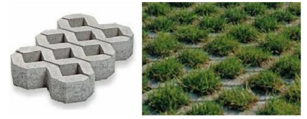
PAVIMENTAZIONE DRENANTE (PREFABBRICATI in CLS RIEMPITI con TERRA ed INERBITI)