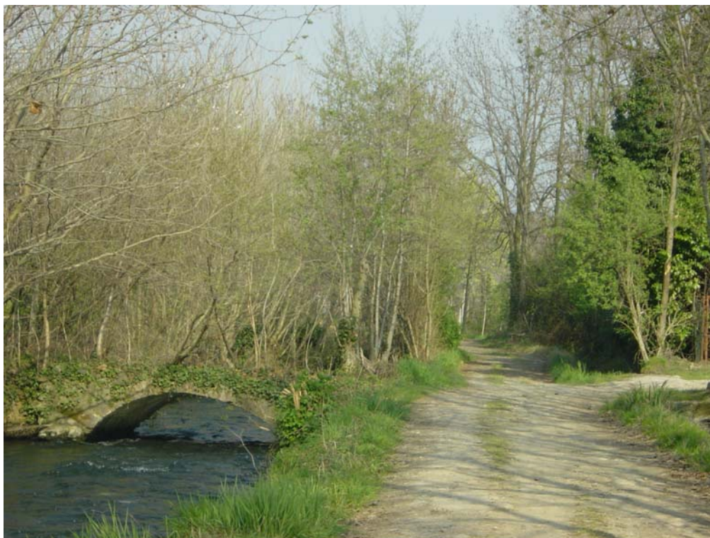
Foto 17 - Ponticello storico sulla roggia Borgogna in area agricola