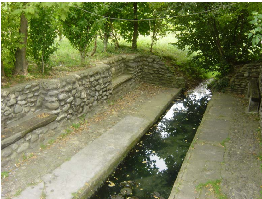
Foto 18 - Il vecchio lavatoio