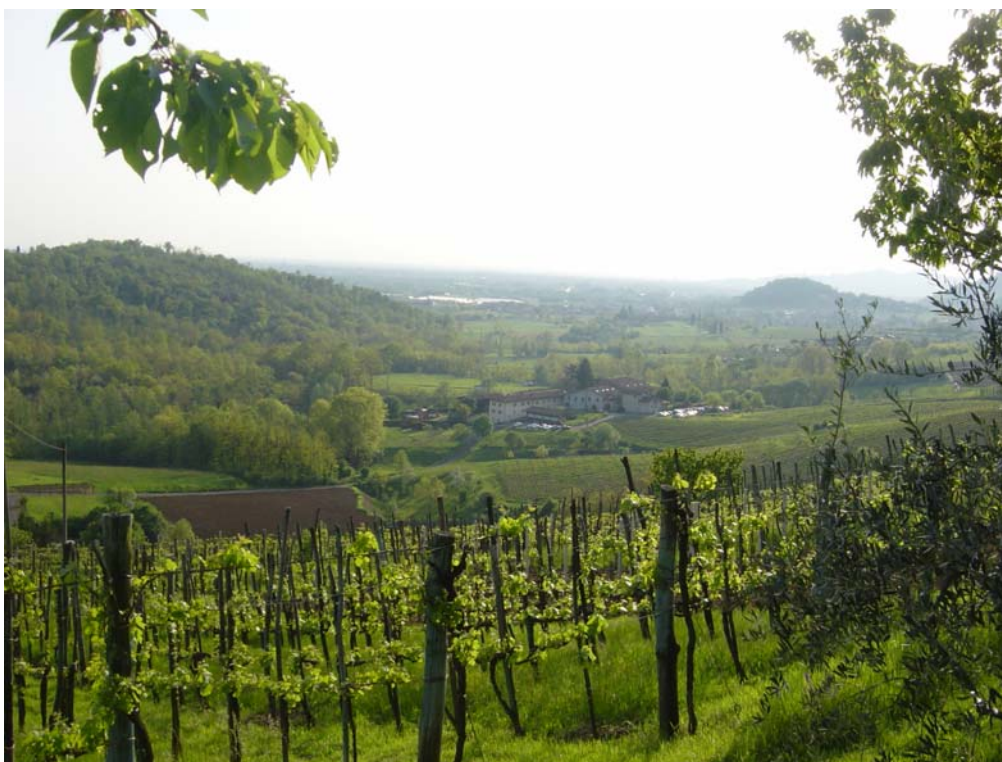
Foto 3 - Vista della valle Serradesca da via Collina Alta