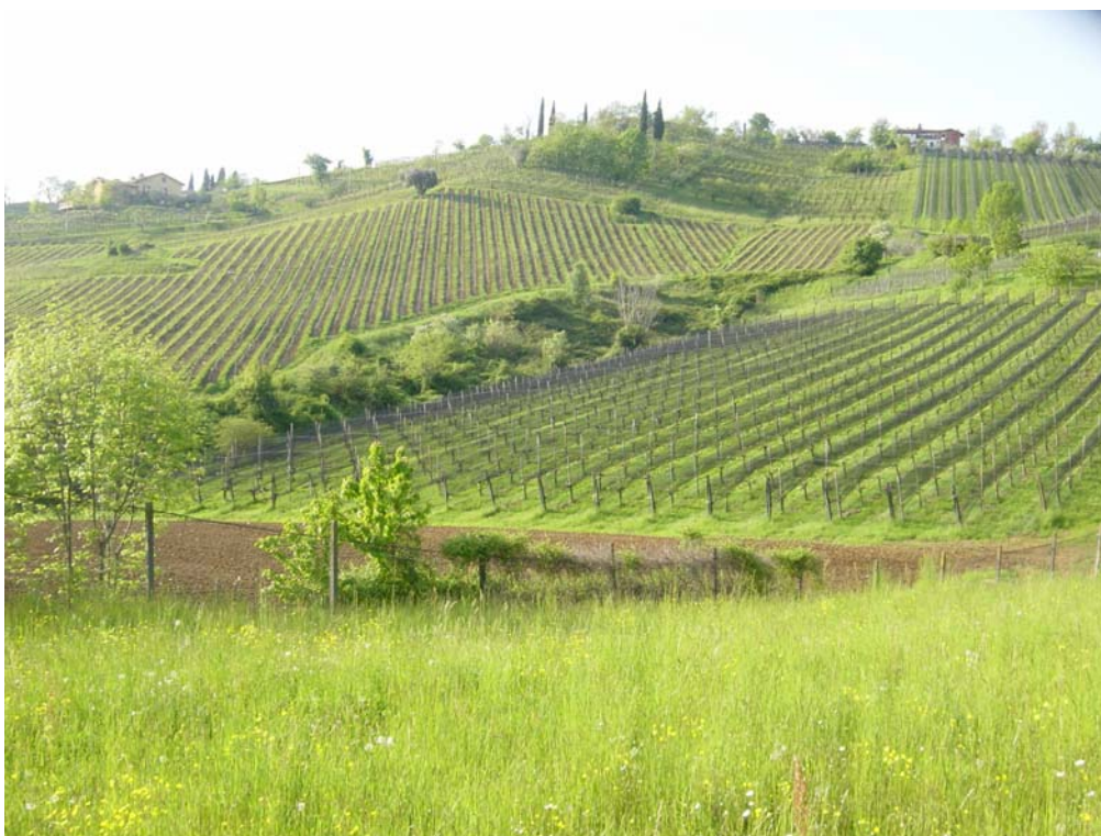
Foto 4 - I “geometrici” paesaggi dei vigneti della valle Serradesca