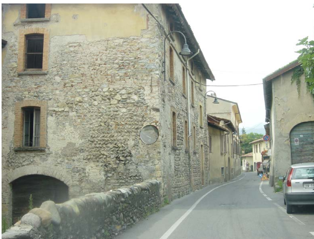
Foto 10 - Scorcio del nucleo storico di Scanzo