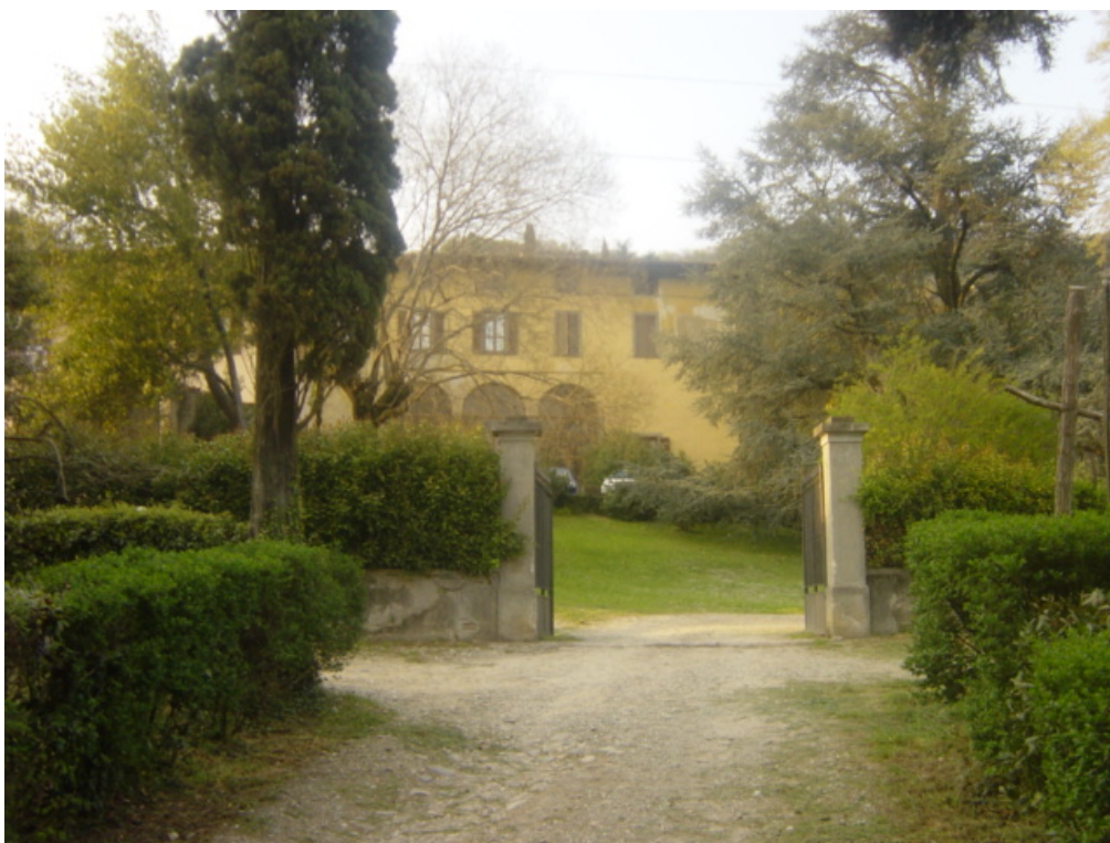
Foto 11 - Villa Zanchi, Medolago, Colleoni, Vestoni, Levati, Giganti