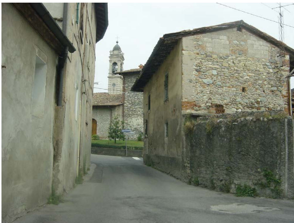
Foto 9 - Scorcio del nucleo storico di Rosciate