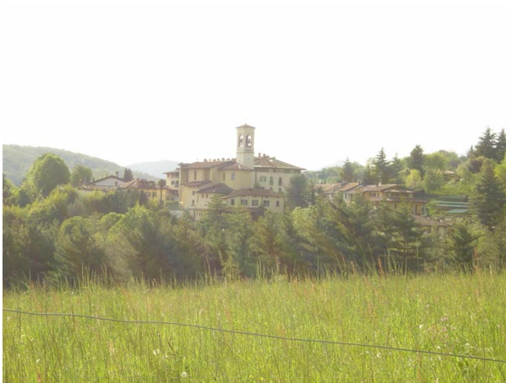
Foto 1 - Vista del Castello di Gavarno