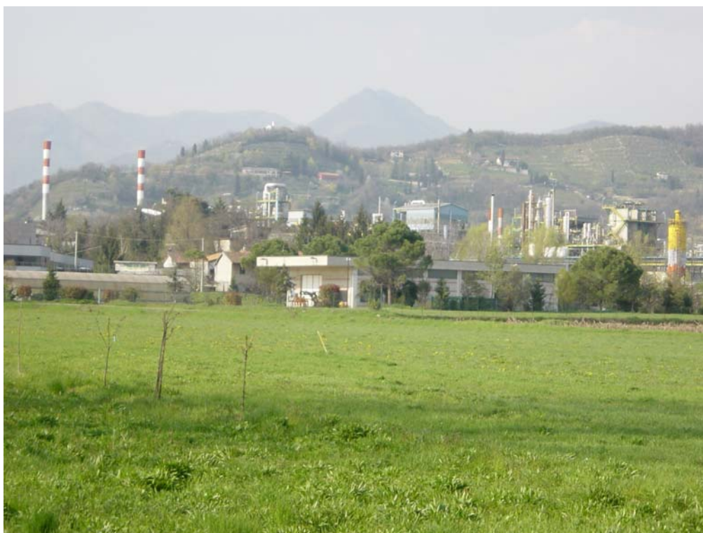
Foto 8 - Il Monte Bastia sottolineato dall'industria nell'area pianeggiante