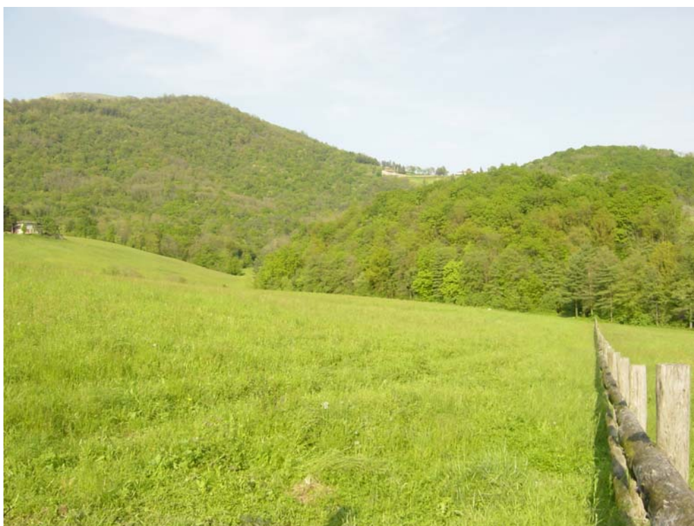
Foto 2 - Veduta dell'area "Foppa del Laghetto" vicino alla località Bocche del Gavarno