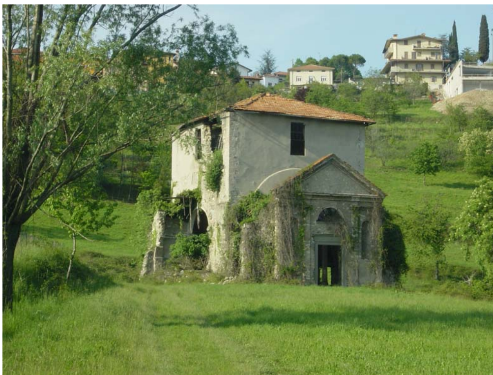
Foto 13 - Chiesa abbandonata di San Giovanni nei Boschi