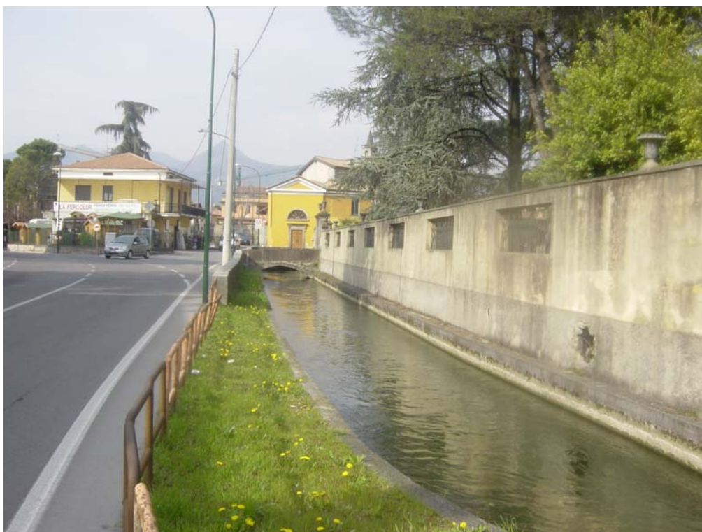
Foto 16 - La roggia Borgogna che chiude parte della proprietà di Villa Brentani