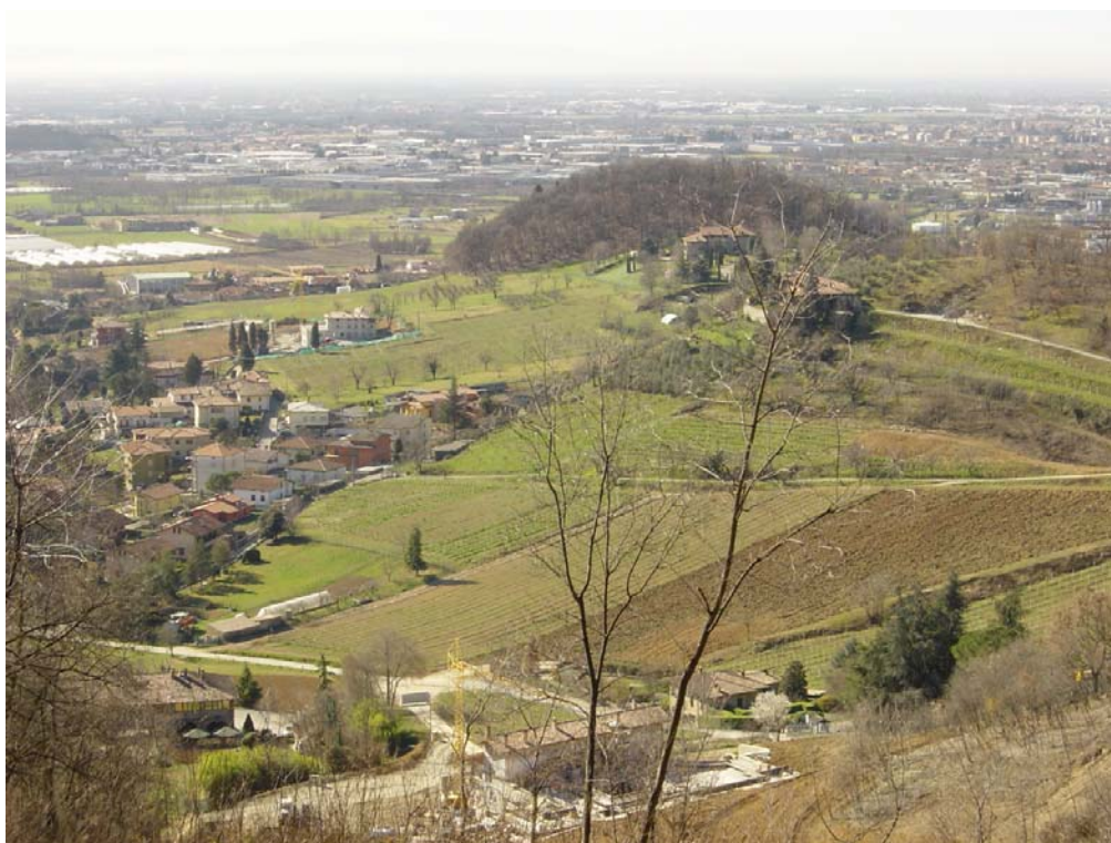
Foto 6 - Vista invernale di Montecchio dai rilievi collinari