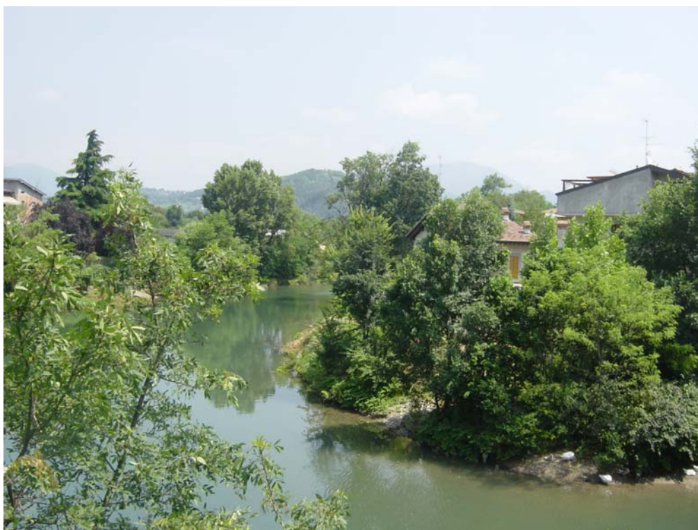
Foto 15 - Il fiume Serio in prossimità dell'antico ponte di Gorle