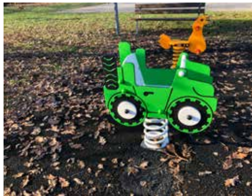
Nuovi giochi nei parchi comunali