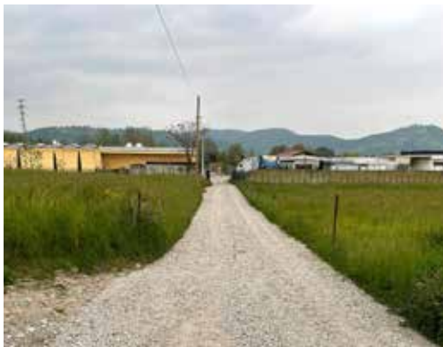
Sistemazione strada bianca di Via Terzago