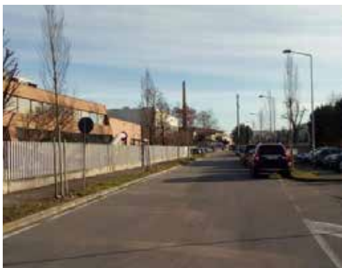
Nuove piantumazioni di carpini nelle aiuole dell'area industriale di Scanzorosciate