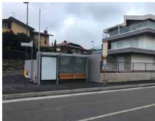
Nuova pensilina ATB in Via Monte Negrone