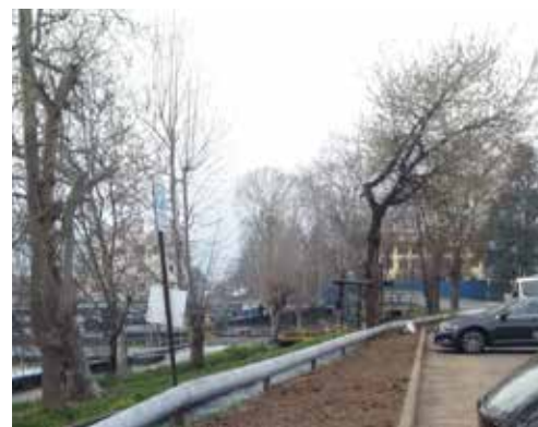
Pulizia ciglio stradale Via Fermi