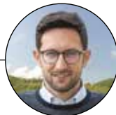
Davide Casati Sindaco con delega al bilancio, sicurezza, urbanistica e personale