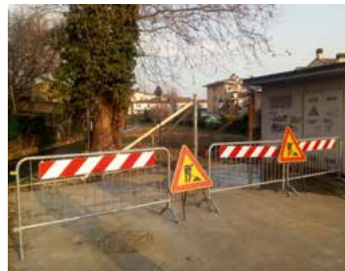
Pulizia area verde di Via Gorizia