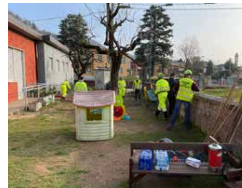
Pulizia area verde Scuola dell'Infanzia di Scanzo