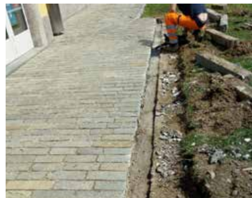
Sistemazione ingresso Poliambulatorio