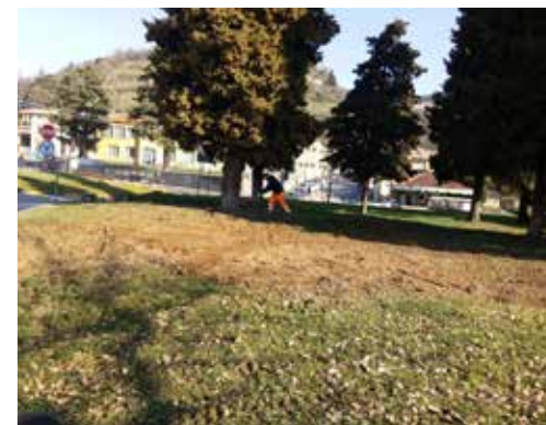
Pulizia area verde vicino al Cimitero di Scanzo