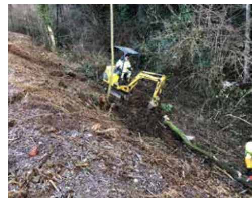
Pulizia parco e valletta di Via Gavarno