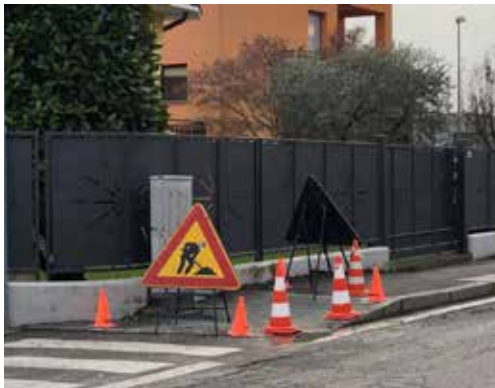
Sistemazione marciapiedi di Via Roma