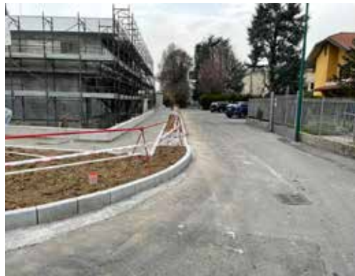
Nuove urbanizzazioni in Via Acquaroli e via Ariosto