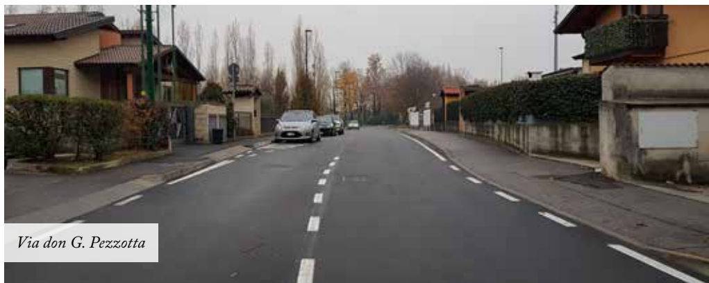
Via don G. Pezzotta

Grazie alla collaborazione dei cittadini che segnalano le situazioni problematiche presenti sul territorio e al monitoraggio costante sia degli uffici che dell'amministrazione continueremo con il miglioramento della sicurezza e della manutenzione dell'intero comune.