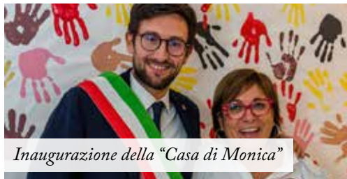
Inaugurazione della "Casa di Monica"