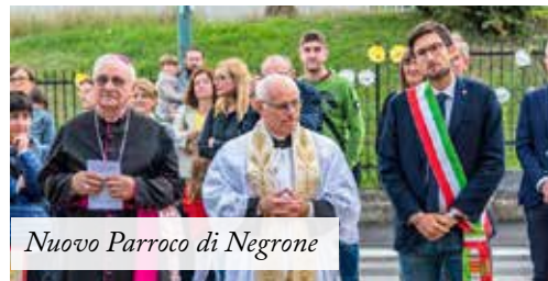
Nuovo Parroco di Negrone