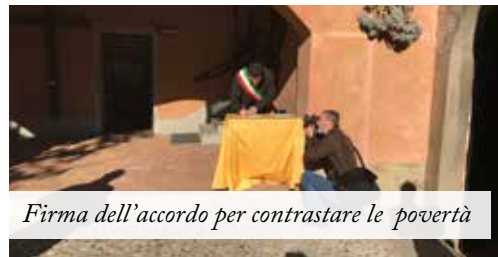
Firma dell'accordo per contrastare le povertà