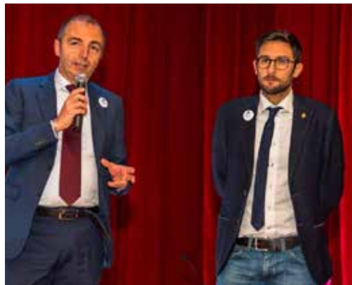
Convegno Nazionale sull'Alzheimer

Ma non è finita, il 2018 vedrà un nuovo cambio di passo... abbiamo lavorato dal 2014 al 2017 per raggiungere obiettivi difficili, ambiziosi, che in alcune fasi ci sono sembrati impossibili... ma c'abbiamo creduto e siamo sicuri che il 2018 sarà l'anno dei "frutti" di questo lavoro.