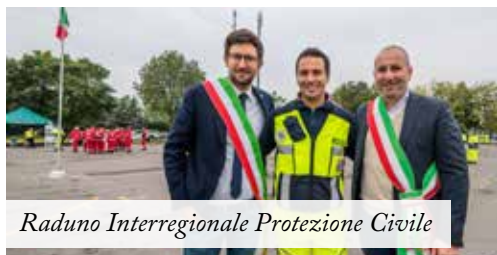
Raduno Interregionale Protezione Civile