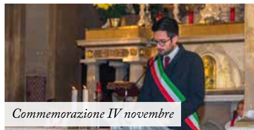
Commemorazione IV novembre