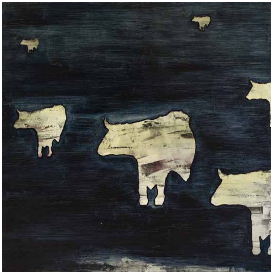
Vito Signorile Mucche di notte, 2014 70 x 70 cm - Tecnica mista su pannello MDF