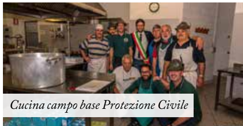
Cucina campo base Protezione Civile