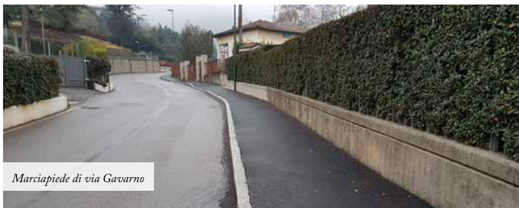
Marciapiede di via Gavarno