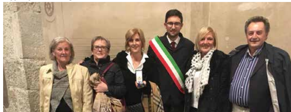
Medaglie d'onore alle famiglie degli internati militari Italiani durante la Seconda Guerra Mondiale