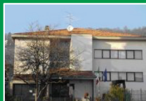
Scuola Primaria "Moro" Rosciate di Scanzorosciate (Bg) Via Maestri del Lavoro