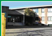
Scuola Primaria "Pascoli" Scanzorosciate (Bg) Via Cav. Vittorio Veneto