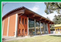
Palestra Oratorio di Scanzo Scanzorosciate (Bg) Via Roma