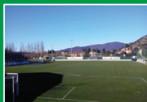
Impianti sportivi Scanzorosciate (Bg) Via Polcarezzo