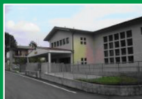
Scuola Primaria "De Sabata" Tribulina-Gavarno di Scanzorosciate (Bg) Via Monte Cervino