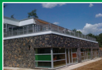
Scuola Secondaria di primo grado "Nullo" Scanzorosciate (Bg) Via degli Orti 37