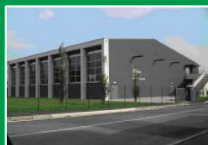
Palazzetto dello Sport Negrone di Scanzorosciate (Bg) Via Ambrosoli