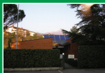
Impianti sportivi Tribulina-Gavarno di Scanzorosciate (Bg) Via Monte Misma