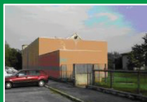
Sala polivalente Negrone di Scanzorosciate (Bg) Via Don Barnaba Sonzogni