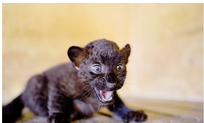
La piccola pantera nata lo scorso 2 luglio alle Cornelle