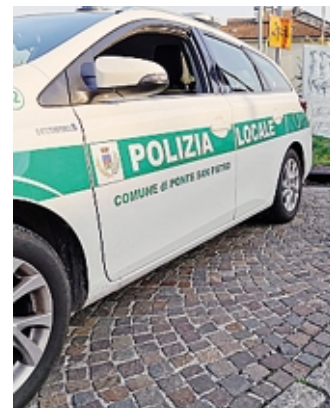
Una pattuglia della polizia locale

Gli stessi avevano postato sui social - a scopo di divertimento - un video che ritraeva le fasi del danneggiamento: proprio il filmato ha consentito alla polizia di Stato del commissariato di identificare i quattro quindicenni. A Ponte San Pietro, invece, la polizia locale è intervenuta al supermercato «Legler» di Via Garibaldi a seguito della segnalazione per la presenza di una persona molesta. Giunti sul posto, gli agenti hanno trovato