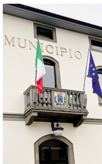
La facciata appena rifatta