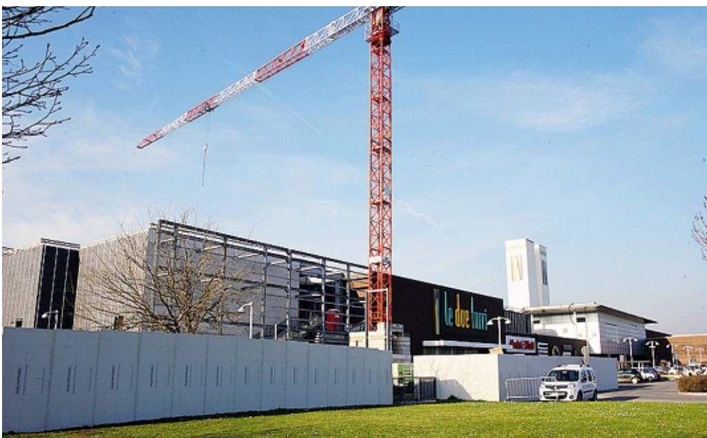
Il cantiere per l'ampliamento del centro Le Due Torri dovrebbe concludersi entro la fine dell'anno

«Nonostante queste evidenti difficoltà - prosegue il