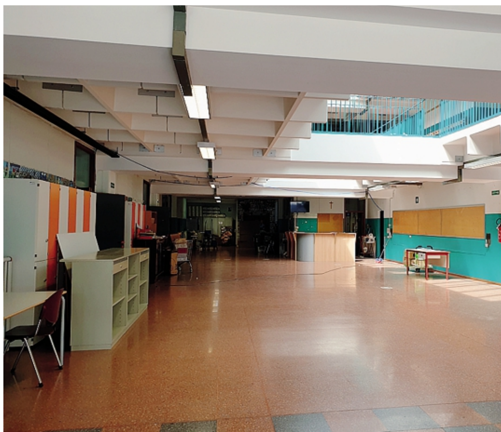
Avviati nei giorni scorsi i lavori di ristrutturazione alla scuola media Francesco Nullo di Scanzorosciate

Una rinnovata scuola media, dunque, attende i ragazzi di Scanzorosciate: più attrezzata, più funzionale, ma soprattutto più sicura e accessibile. «In effetti, ora tutte le parti della scuola sono state risistemate -