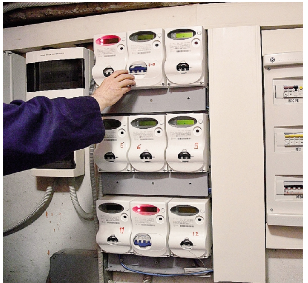
L'aumento dei costi di elettricità e gas pesa sulle casse del Comuni