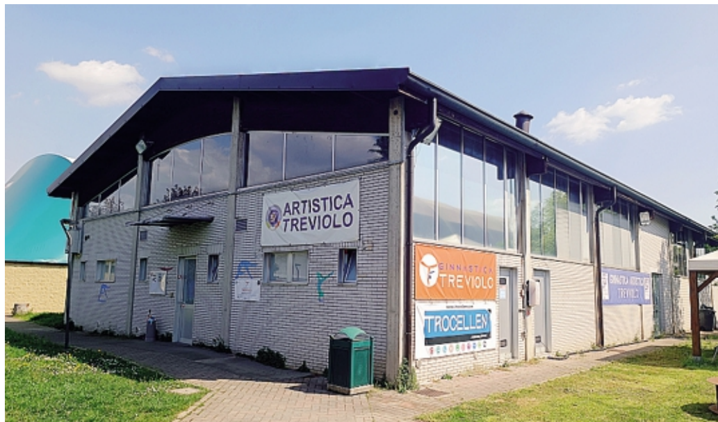
La palestra di Curnasco di Treviolo, i lavori di ampliamento sono quasi terminati

La palestra curnaschese, infatti, è da diversi anni la «casa» della società sportiva treviese, una delle eccellenze bergamasche nell'ambito sportivo e agonistico. Qui, ogni anno, si allenano centinaia di giovani e giovanissime atlete, alcune dei quali in corsa anche durante gli eventi agonistici a livello nazionale. Proprio dalla necessità di fornire loro ulteriori possibilità per ampliare e diversificare i loro allenamenti è nato questo progetto, dal valore di circa 350mila euro ottenuti tramite un bando a livello regionale, che porta l'ampiezza