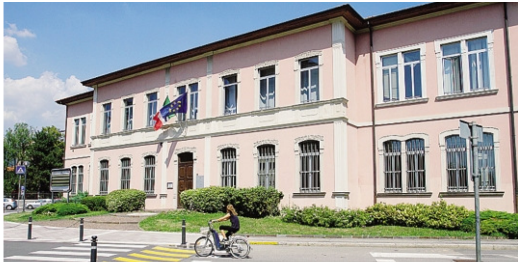
Il Municipio di Torre Boldone: l'anno prossimo si andrà alle urne per rinnovare l'amministrazione comunale