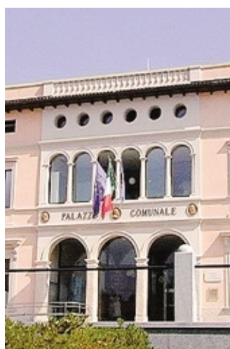
A settembre lo Sportello Alzheimer si sposta al mercato

Domenica 16 settembre alle 10,30 al Parco Primavera (adiacente al Circolo Pensionati),