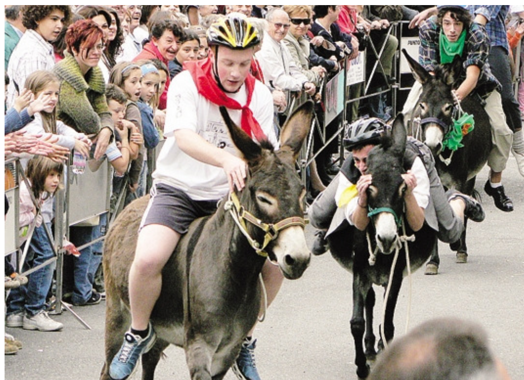
Una delle passate edizioni del palio degli asini