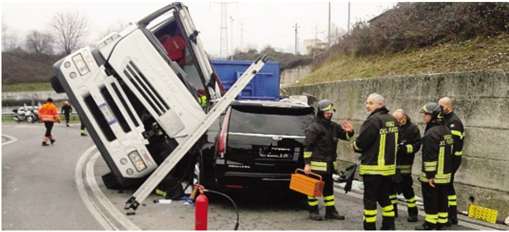
L'autoarticolato e l'auto coinvolti nell'incidente di ieri mattina sull'asse interurbano

L'autoarticolato trasportava rottami di ferro che si sono rovesciati sull'asfalto