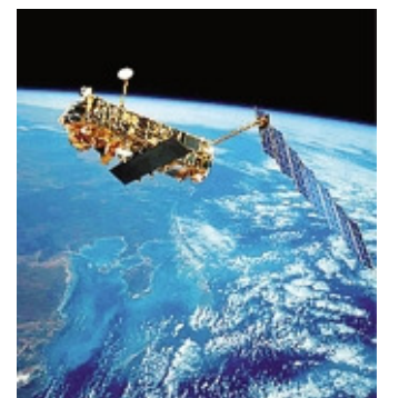
Un satellite in orbita sulla Terra