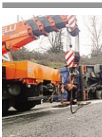
La gru al lavoro per spostare il camion

Grande spavento sull'asse interurbano in seguito al ribaltamento di un autoarticolato. Ieri intorno alle 10,50 un camionista alla guida di un Iveco Stralis procedeva sull'asse provenendo da Lecco in direzione Bergamo quando, immettendosi sullo svincolo per Dalmine, si è ribaltato sul fianco sinistro, invadendo la corsia opposta e schiacciando un'auto, una Cadillac Escalade nera del valore di 100 mila euro, e urtando di