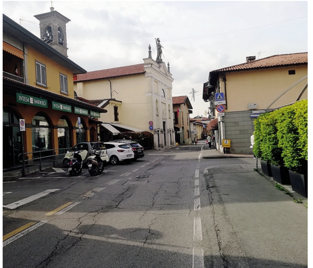
Via Roma, in centro a Grassobbio, sarà la strada principalmente interessata dalla riqualificazione