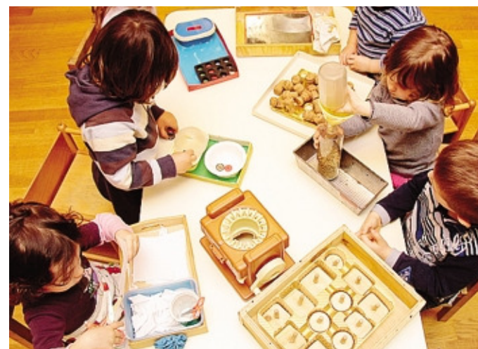
Bimbi giocano in un asilo nido, in una foto d'archivio

allegato al bando, consultabile e scaricabile dal sito del Comune di Valbrembo, potranno essere presentate a partire dall'1 febbraio 2017 e fino alle 12,30 del 15 maggio 2018, o fino a esaurimento dei fondi stanziati dal Comune. La graduatoria delle domande ammissibili sarà in ordine crescente in base al valore Isee del nucleo familiare, e l'erogazione del contributo verrà distribuita in tre rate. Per ulteriori informazioni, consultare il sito www.comune.valbrembo.bg.it .