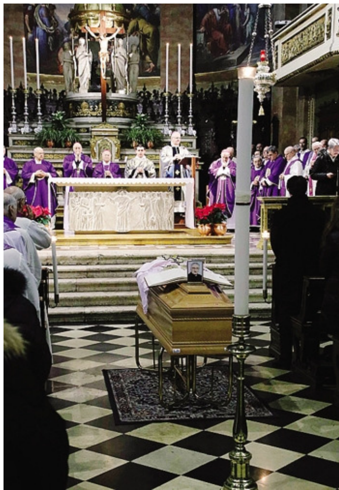
Un momento della cerimonia funebre